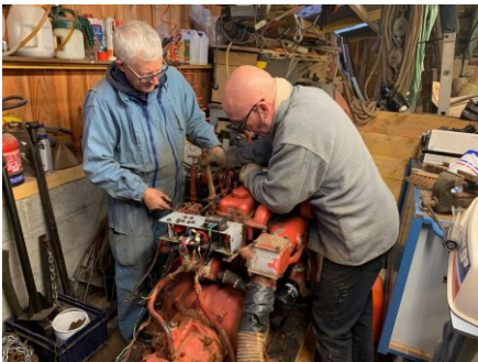
De la mécanique...