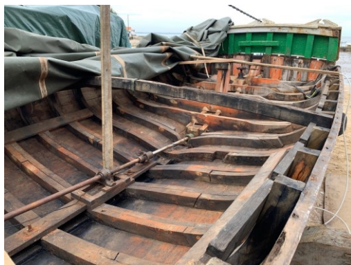
Janvier, gros nettoyage de la cale

Il a été au cœur de nos préoccupations durant toute l'année 2020 et il le restera quelques mois encore.