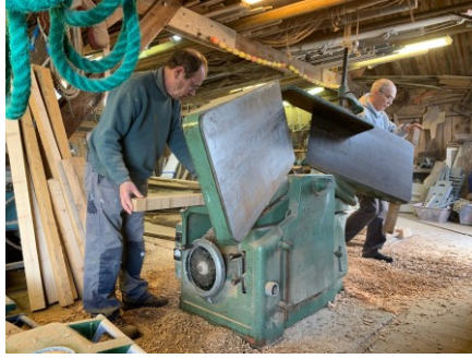
Fais des copeaux...