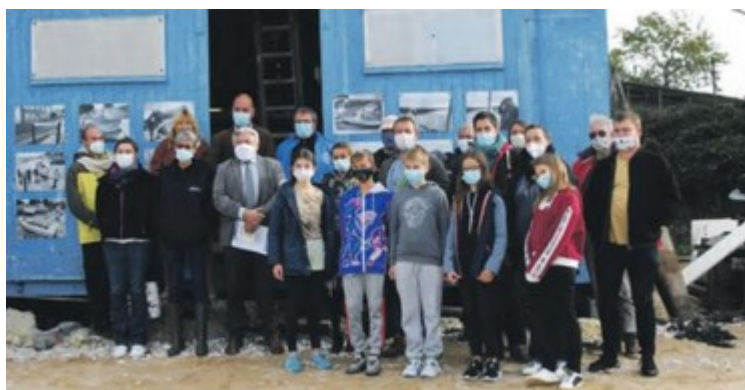
Les jeunes du collège Jean Hay de Marennes

Ce projet veut développer une culture maritime auprès des jeunes générations et les sensibiliser au patrimoine maritime local, ainsi qu'aux métiers de la mer pour peut-être faire naître, chez certains, une vocation professionnelle.