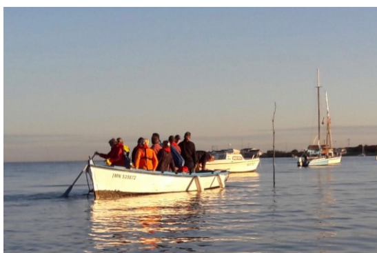
Boat people ? Embarquement dans la baie du Chapus

Organiser la sortie d'un bateau, ce n'est pas toujours facile. Ceux que nous croisons dans le pertuis le savent bien.