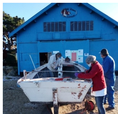
... comme à l'extérieur, tous masqués

Retrouvez dans ce nouveau bulletin, les moments forts de cette année bien particulière et celles et ceux qui font la force et le plaisir de notre association.