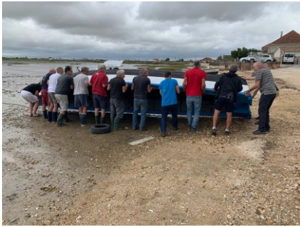
En petit comité...