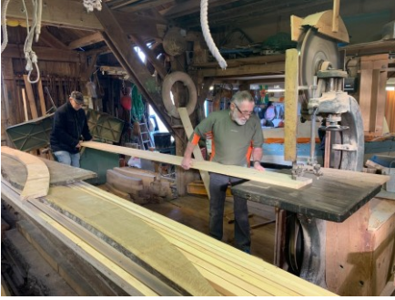
Scié du bois...