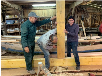
Du gros oeuvre...