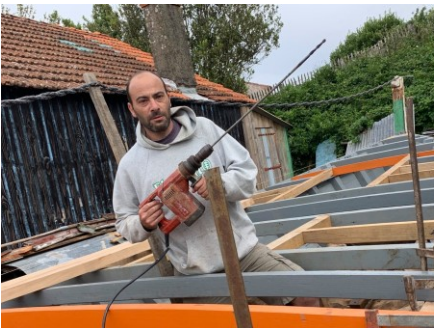
Fait des trous...