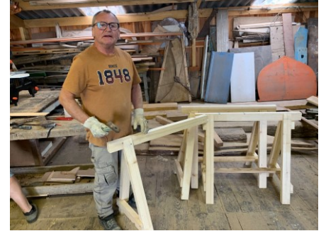
Des tréteaux de pro...