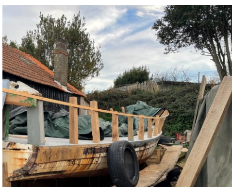
Aux œuvres hautes maintenant

Son dossier devait être présenté en réunion de classement au début de l'année puis en fin d'année.