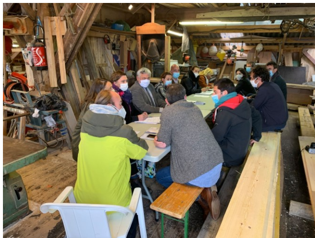
Lancement du projet au chantier Rabeau