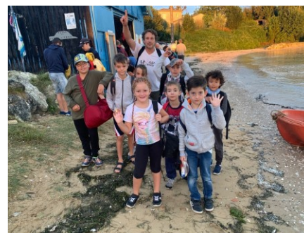
Accueilli des jeunes...