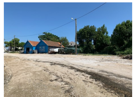
Un très grand ménage...