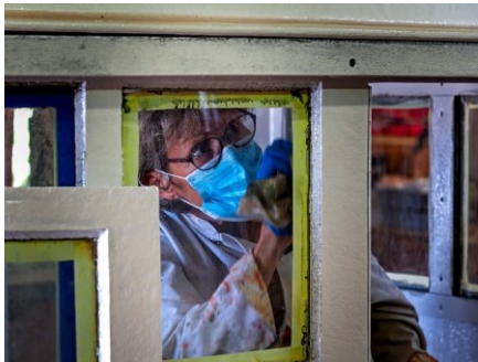
Et peint encore...