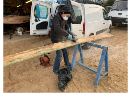
Et de la poussière...