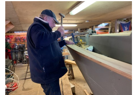
Enfoncé des pointes...