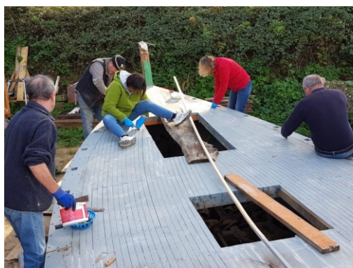
Début novembre, le pont est terminé