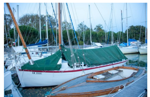
Général Leclerc dans son nouvel abri hivernal du port de Marennes

Discours et buffet clôturent cette journée chargée d'émotion.