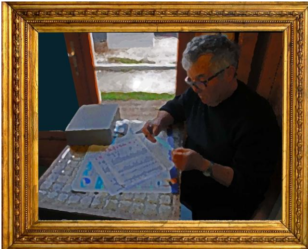
Le Comptable par Vermeer (musée Légiise)